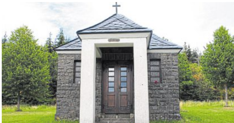
Auch in diesem Jahr soll es eine Prozession zur Wendelinuskapelle geben, die aber wegen Corona anders sein wird als gewohnt.

Um 15 Uhr feiern die Teilnehmer eine gemeinsame Andacht – natürlich mit Abstandhalten. Wer keine Möglichkeit hat, zur Kapelle zu kommen, kann ab 14.15 Uhr vom Dorfplatz „Huggert“ aus einen Fahrservice in Anspruch nehmen. Nach dem Gottesdienst besteht Gelegenheit, bei einem selbst mitgebrachten Picknick noch etwas länger an diesem schönen Ort zu verweilen. „Wir freuen uns auf eine ganz außergewöhnliche Wallfahrt mit vielen Teilnehmern aus den Lasterbachorten und aus Rennerod und hoffen, dass die Idee einer individuellen Wendelinusprozession breiten Anklang findet“, betont der Ortsausschuss. Bei Regenwetter findet die Andacht in der Kirche in Westernohe statt.